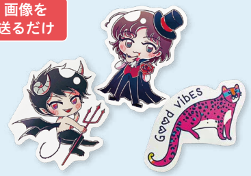
ダイカットステッカー