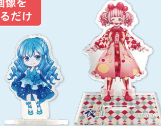
アクリルスタンド