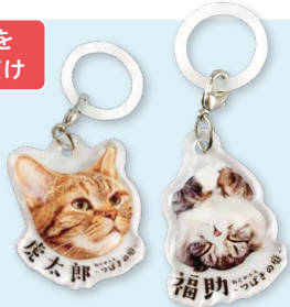
アクリルマーカチャーム