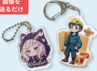
アクリルキーホルダー