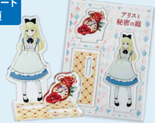
アクリルジオラマ