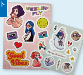
マルチステッカー